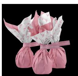
Rabitos Royale Ruby rb201