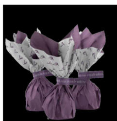
Rabitos Royale White rb200

Rabitos Royale Dark – Fylld med mörk chokladtryffel med smak av Cognac, doppade i mörk choklad. Ljuvliga till ett glas Cava eller Portvin.