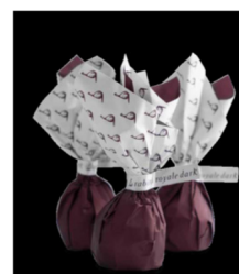
Rabitos Royale Dark rb203