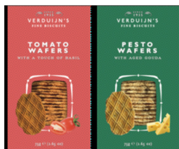
Tomato & Basilika vs107