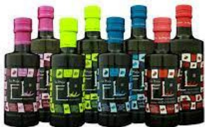
La Maja EL Limited Edition Im200-Im201-Im202-Im203

ARBEQUINA ORGANIC – En unik olja med mycket karaktär. Smakrik och fruktig med gröna inslag av banan, kronärtskocka, mandlar med en härlig pepprig avslutning