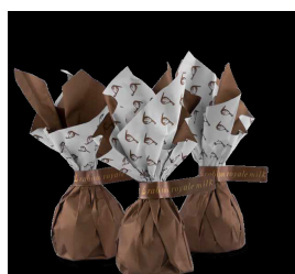
Rabitos Royale Milk rb202