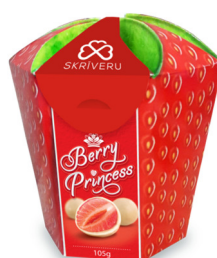
Strawberry Princess sk100

Frystorkade Jordgubbar av suverän kvalitet som doppas för hand i finaste vita chokladen. Fint packade i en Jordgubbsask med smak av sommaren. Ljuvliga till ett glas bubbel!