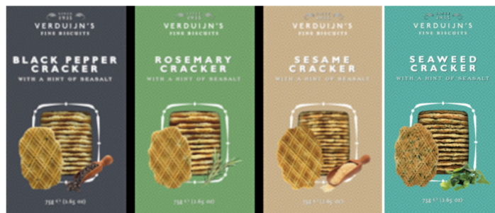
Blackpepper & Seasalt vs104