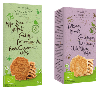
Org Apple & Cinnamon vs110