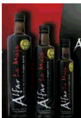
La Maja extra virgin olive oil Im100-101- 102

En unik och mycket exklusiv olivolja från gårdens främsta olivträd, mycket liten violym. Fantastisk arom och smak som påminner om färsk frukt med gröna inslag. Ljuvlig till det mesta och tar gastronomin till himlen. Otroligt fin flaska som levereras i fin present kartong.