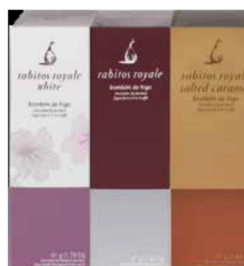
Presentask 3-pack rb100